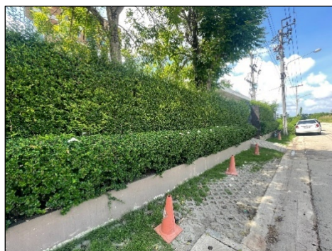
กรวยจราจร