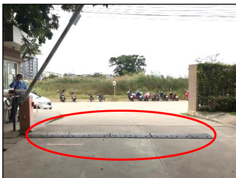
ลูกระนาดชะลอรถ (หลังเต่า)