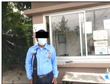
รูปที่ 2-2 เจ้าหน้าที่รักษาความปลอดภัย