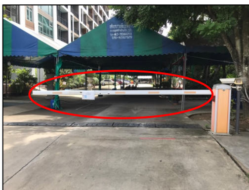
แผงกั้นจราจร